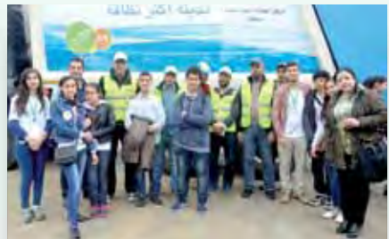
Espace SITA Boughaz JDD 2016