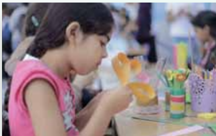
Atelier Eco-Créativité JDD 2018