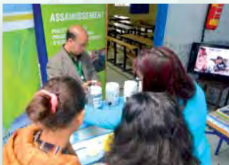
Contrôle de la qualité d'eau par l'ONEE - Branche Eau