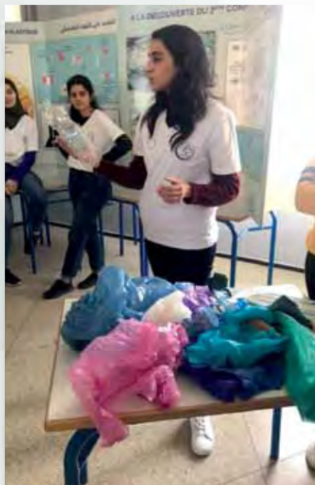
Atelier SOS Microplastique Lycée Paul Valéry Meknès février 2020