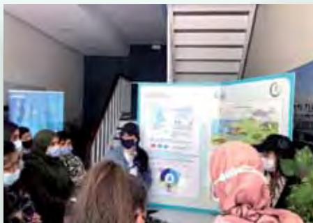
Atelier « Eau d'où viens-tu ?