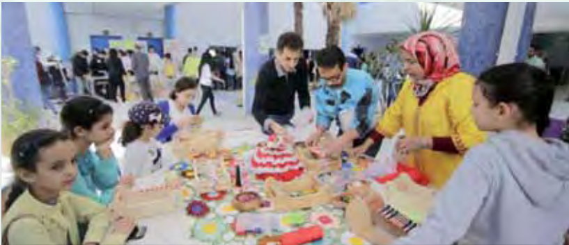
Atelier Recyclage Artistique JDD 2018