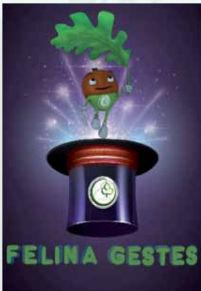
Jeu de société « FELINA GESTES » Copyright © AMED,